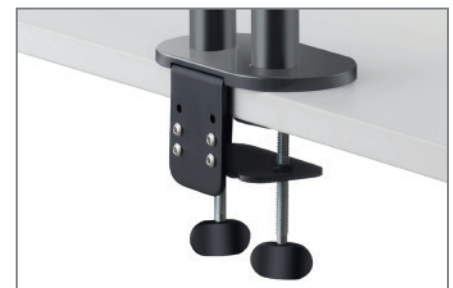
für Tischplatten zwischen 10 und 70 mm