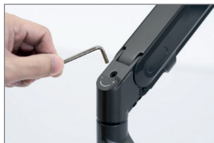
auf Gerätegewicht einstellbar