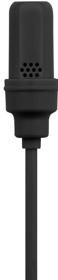
UL4B UniPlex Subminiatur-Lavaliermikrofon mit Nierencharakteristik (Schwarz)