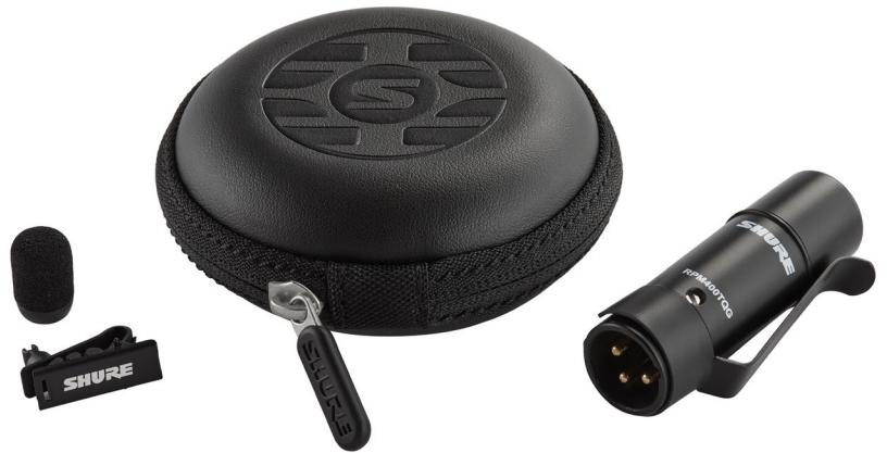
Im Lieferumfang enthaltenes Zubehör Variante RPM400 (Schwarz)