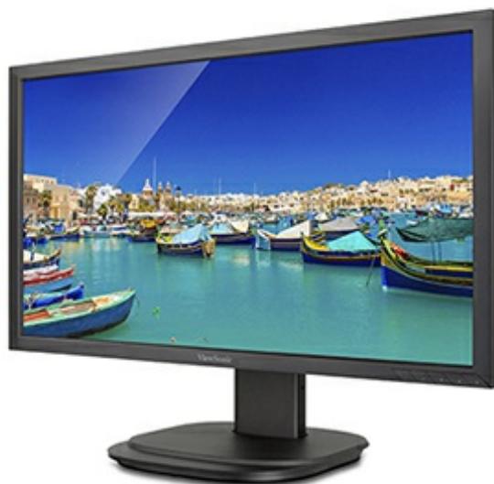
ViewSonic Flicker-Free Technology