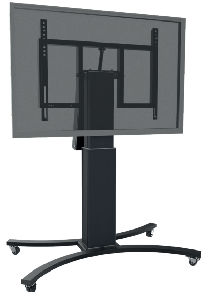
Adjust-V4286B mit Kippfunktion - 50cm

Die Schrägstellung wird ebenfalls (neben der Höhenverstellung) per mitgelieferter Kabelfernbedienung gesteuert und erlaubt ein Kippen bis zu 90° und Verwendung Ihres Displays im Tischmodus. Die Möglichkeit der Kombination mit zahlreichen Zubehörartikeln wie PC Ablagen, Transportgriffen und Whiteboard Seitenflügeln trägt weiterhin zur Erhöhung des Bedienerkomforts und zur Verbesserung der Einsatzmöglichkeiten im Schulungsbereich bei. Das Produkt wird zerlegt in drei Paketen geliefert. Alle Verpackungseinheiten sind Paketdienst fähig.