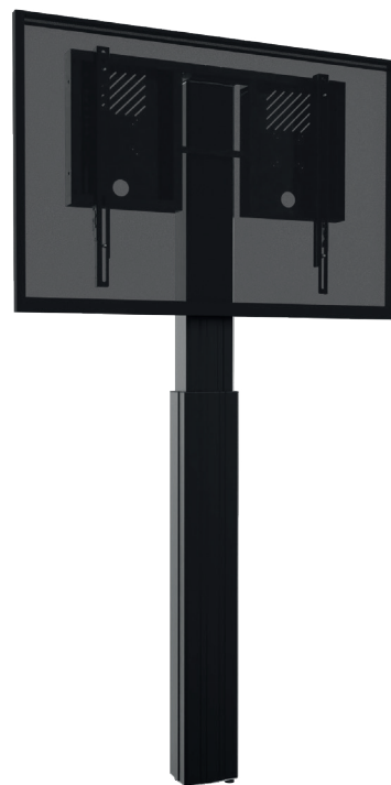
Adjust-4286WB mit Wandbefestigung - 90cm

Die hochwertig verarbeitete, absolut formstabile Aluminiumsäule mit integriertem, leistungsstarkem Stellantrieb inkl. mitgelieferter Kabelfernbedienung ermöglicht eine simple Höhenverstellung auf Knopfdruck mit 90cm Hub .