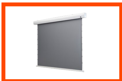
HomeCinema Motor Tension Dynamic Slate

Überreicht durch Ihren celexon Fachhändler: