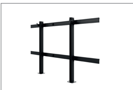
geringer Platzbedarf dank Boden Wand Montage