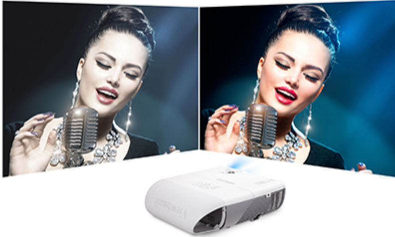
ViewMatch® Color Mode