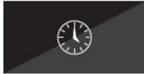
Verfolgen der Lebensdauer der Lichtquelle