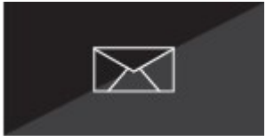
Mail-Warnungen und Sofortbenachrichtigungen, Helpdesk-Anfragen, Service-Erinnerungen, Ausfall oder Diebstahl des Gerätes