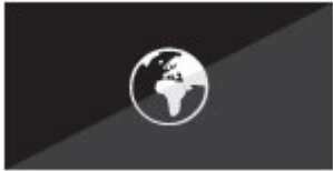
Überwachung aller AV-Geräte

Mehrere ZU510T Projektoren können via LAN überwacht werden. Mittels Crestron RoomView wird der Benutzer über eine E-Mail benachrichtigt, sollte ein Fehler auftreten oder eine Lichtquelle ausfallen oder ersetzt werden müssen. Die Web Browser Schnittstelle und die volle Unterstützung von Extron's IP Link, AMX Dynamic Device Discovery und PJ-Link Protokolle erlaubt es Ihnen, so gut wie alle Aspekte des ZU510T über ein Netzwerk zu steuern und so immer die Kontrolle zu behalten, egal wo Sie sind.